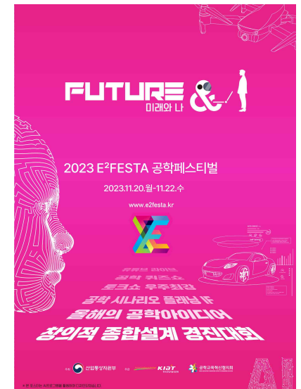
2023 공학페스티벌 포스터

Future & I 2023 공학페스티벌에서 미래와 나의 이야기가 펼쳐집니다.